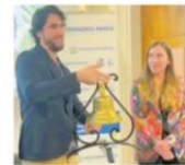
Dotto Trains con la campana