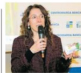
"Nonno Nanni", il simbolo