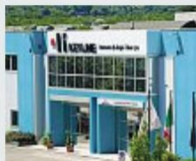
A Conegliano La sede di Keyline

TREVISO «A livello di azienda e struttura siamo in un momento di cambiamento importante, sia internamente, con un forte rinnovamento tecnologico, di management e di processo, sia su linee esterne con integrazioni di aziende sinergiche». Ne