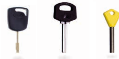
Ford e Jaguar Ford and Jaguar Ford und Jaguar Ford et Jaguar Ford y Jaguar

Falcon is the only mechanical key cutting machine for special keys that combines ease of use and strength, thanks to the design of its base and to the reliable accessories, that guarantee the perfect stability of the key during the cutting phase, thus guaranteeing a perfect execution.