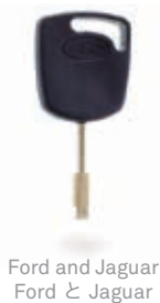
Ford and Jaguar Ford と Jaguar