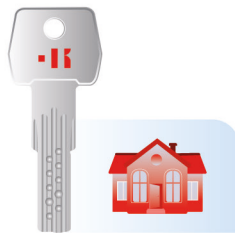
PROM023-010 Autocollant Clé à points 41 x 40 cm