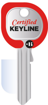
PROM023-008 Autocollant Clé Keyline 27,5 x 60 cm