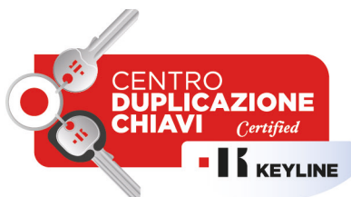
PROMO23-012-IT Adesivo Centro Duplicazione Chiavi 75 x 41 cm