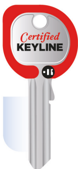
PROMO23-008 Adesivo Chiave Keyline 27,5 x 60 cm