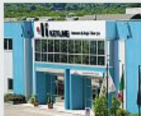
A Conegliano La sede di Keyline

TREVISO «A livello di azienda e struttura siamo in un momento di cambiamento importante, sia internamente, con un forte rinnovamento tecnologico, di management e di processo, sia su linee esterne con integrazioni di aziende sinergiche». Ne