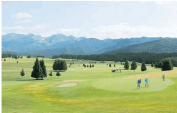
Il green del Pian Cansiglio, oggi la prima gara stagionale