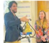
Dotto Trains con la campana

Roncade, gestita tutta al femminile, da piccola produzione contoterzista è diventata un nome di punta nel settore delle sedute per ufficio e prodotti per la casa.