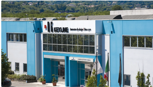
Nasce Keyline Industries, nuovo polo industriale per le automazioni e soluzioni di accesso intelligente

DI REDAZIONE QDPNEWS.IT - VENERDI, 6 SETTEMBRE 2024