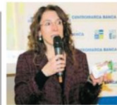
"Nonno Nanni", il simbolo