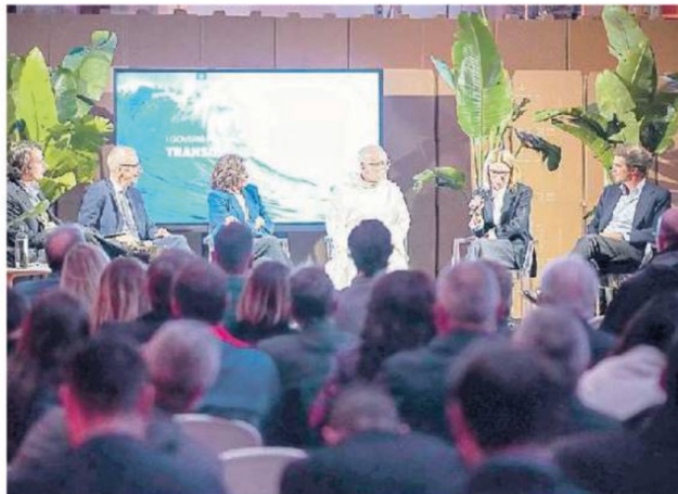
CONEGLIANO Una fase del dibattito organizzato in Keyline