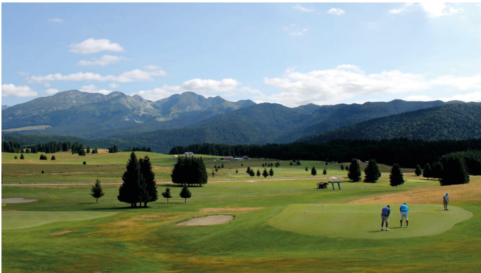
Il golf club e il suo campo da gioco

La "Keyline Golf Challenge" si terrà lungo le 18 buche che si snodano su circa 80 ettari per una lunghezza di 6.077 metri ad un'altitudine di 1.027 metri